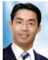
Dr. Philipp Rösler

Die FDP ist der politische Anwalt der Mitte unserer Gesellschaft. Gerade in Zeiten des Wandels braucht Deutschland eine liberale Kraft: die FDP. Warum? Wir nennen Ihnen die Gründe.