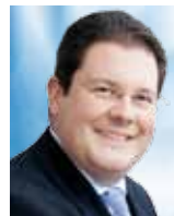
Patrick Döring, MdB

FDP-Generalsekretär und stv. Vorsitzender der FDP-Bundestagsfraktion