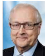
Rainer Brüderle, MdB

Bundesvorsitzender der FDP und Bundesminister für Wirtschaft und Technologie