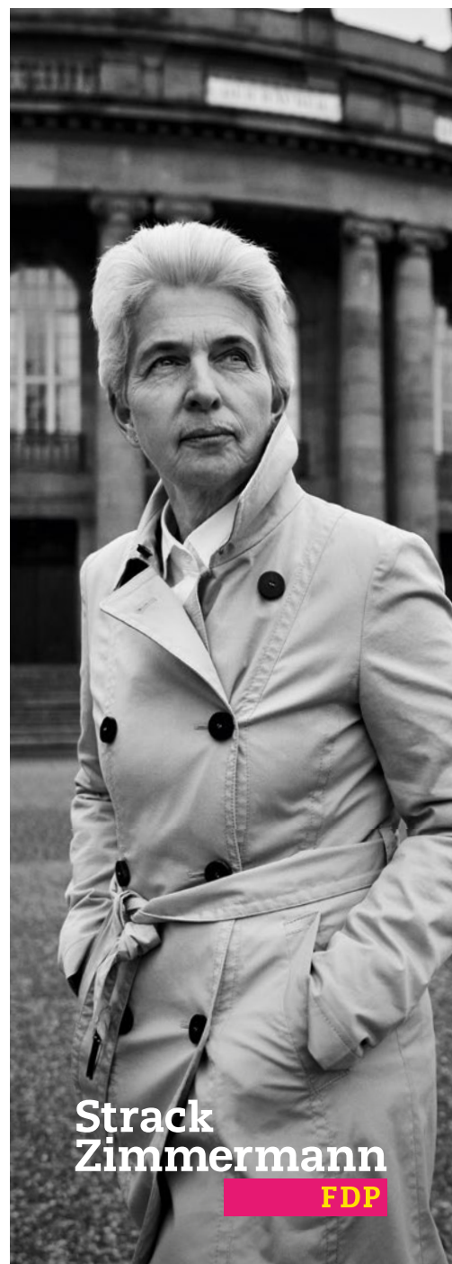
Strack Zimmermann FDP